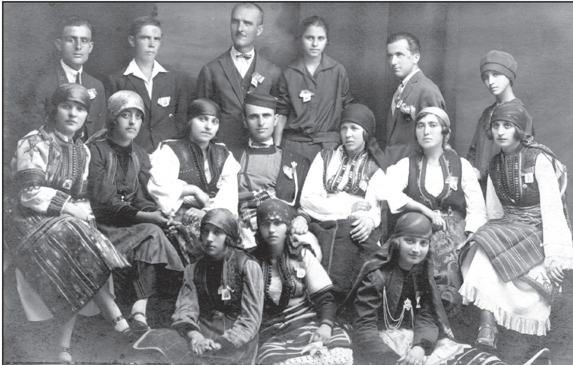
Българи, бежанци от Македония

След негова смърт от 1999 до 2001 г. в енорията от изто-