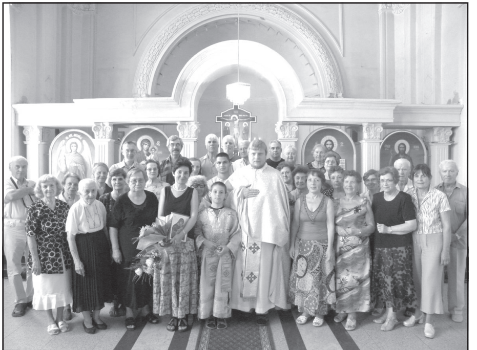
Енория Бургас, „семеен кръг“

Отговорът на този въпрос не е еднозначен. Сигурно бургаската енория днес не се различава много от други униатски общности в България. Както те, така и тя преди всичко е малка. Макар в Бургас да живеят неколкостотин католици, от които поне половината са кръстени в източен обред, в