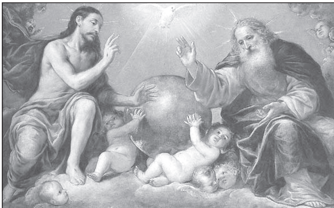
„Света Троица“ - Антонио де Перега